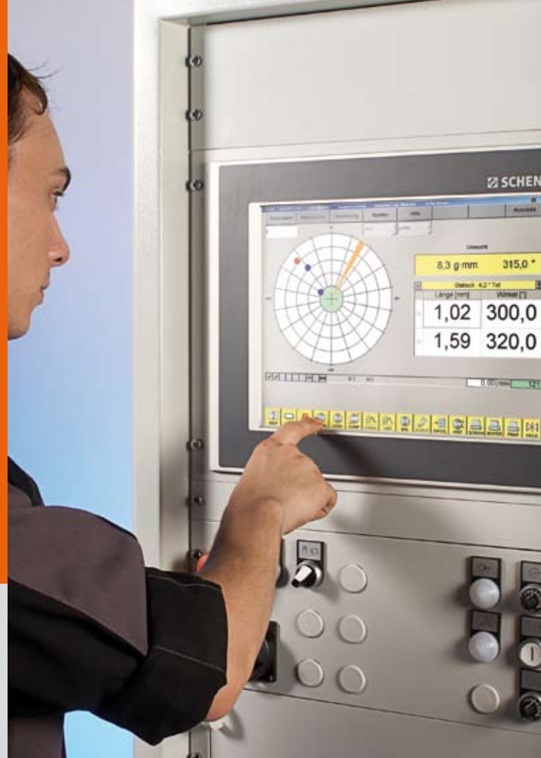
Klare und eindeutige Dialoge unterstützen den Bediener beim Auswuchten.

Mit der VIRIO erreichen Sie Investitionssicherheit über den gesamten Lebenszyklus der Maschine hinweg. Nachrüsten mit einem Ausgleichmodul, erweitern auf eine zweite Messebene – oder darf's einfach nur eine größere Schutzhaube sein? Mit dem flexiblen Konzept der VIRIO wird alles möglich.