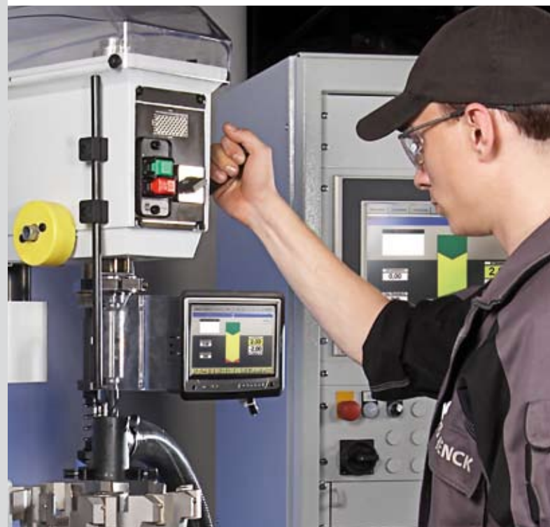
Einfach genial – ein kleines Zweitdisplay zeigt die Ergebnisse direkt im Blickfeld.