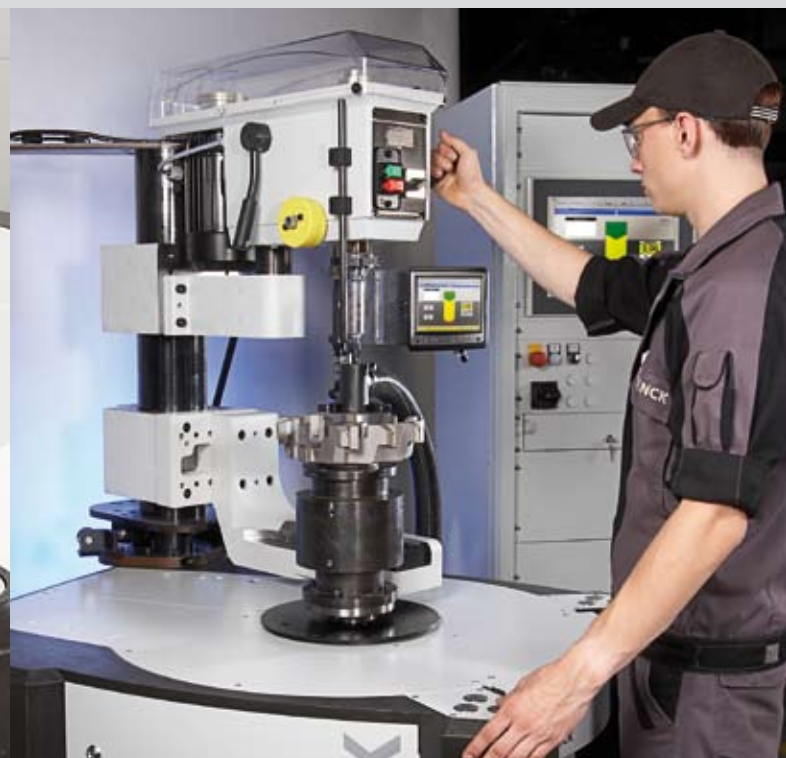
Auch kleine, leichte Rotoren lassen sich mit hoher Genauigkeit auswuchten.